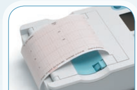
FACILE À LIRE

Permet de gagner un temps précieux et garantit la capture de données précises grâce à la mise en évidence des signaux faibles et des connexions défectueuses.