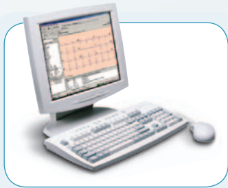
Welch Allyn CardioPerfect™ Workstation