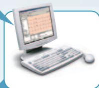
Logiciel Welch Allyn CardioPerfect™ Workstation

Enregistrez vos données de tests et vos informations patient dans des dossiers individuels dans votre EMR à des fins d'analyse et de stockage permanent