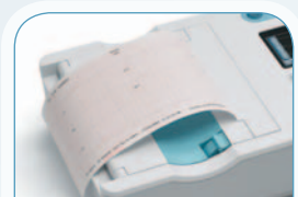
FACILE À LIRE

Un gain de temps important et la garantie de données exactes, l'appareil indiquant tout signal et toute connexion de faible qualité.