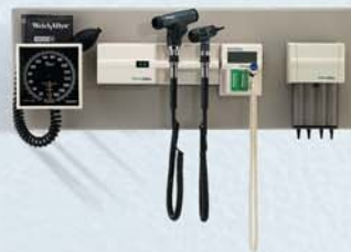
76791-2MP2 Système de diagnostic intégré