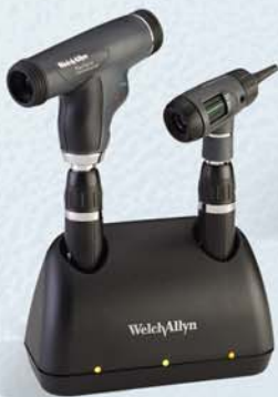
71812-MPS Ensemble de chargeur de table