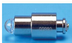
Ampoule de rechange