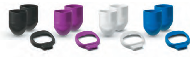
Welch Allyn Pocket LED bumper de poignée et de la fenêtre d'Otoscope

Personnalisez votre outil avec les accessoires :