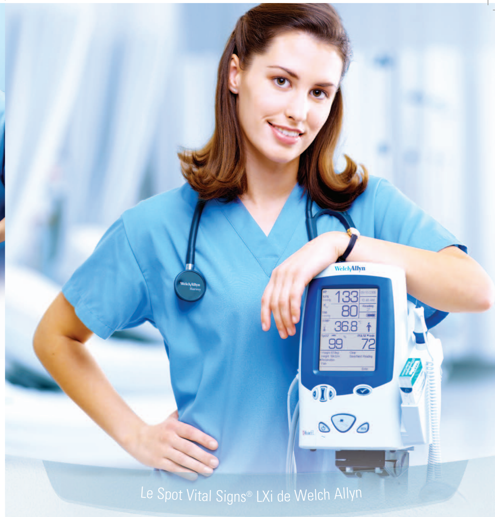
Le Spot Vital Signs® LXi de Welch Allyn