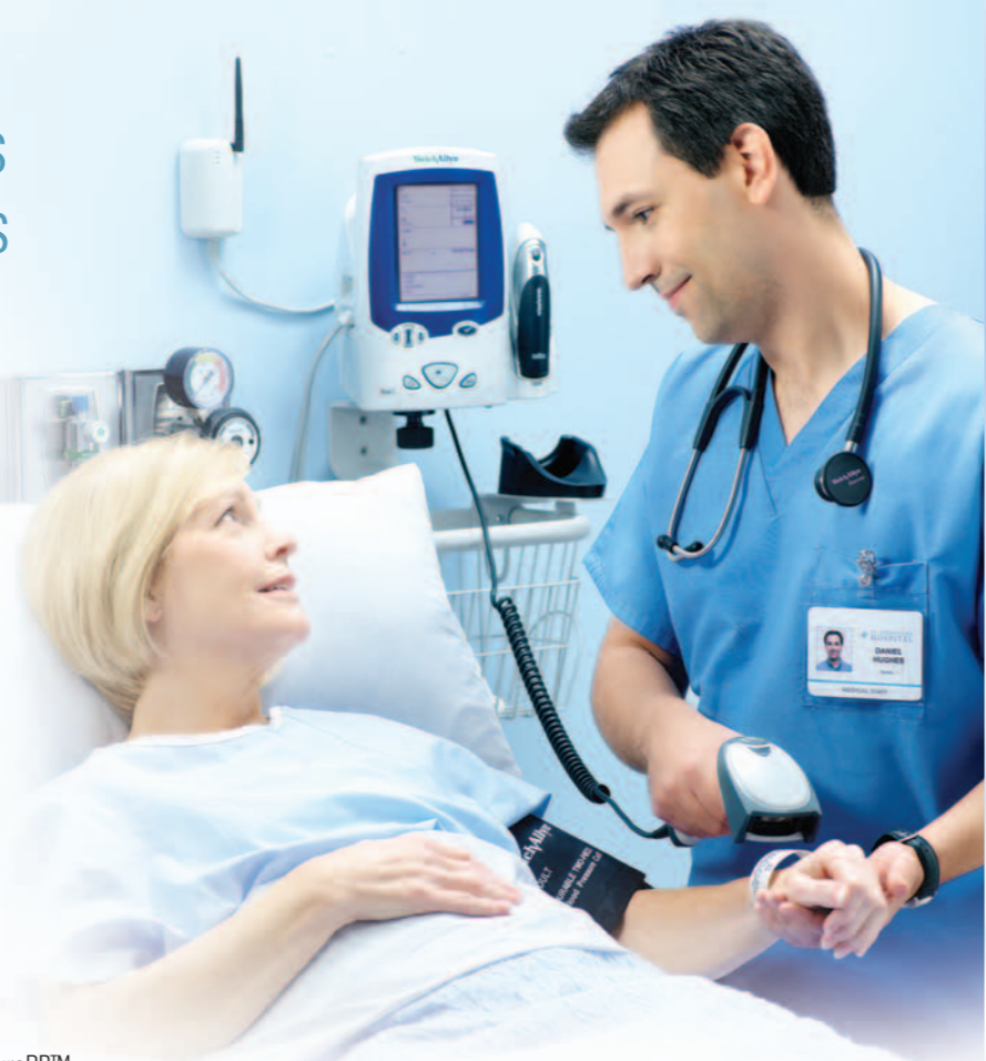
Le Spot Vital Signs® LXi peut être utilisé sur un support mobile, un support mural ou un bureau.