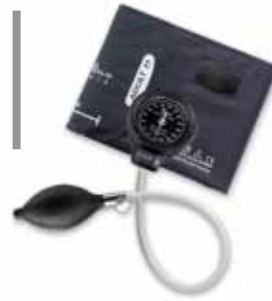
Anéroïde de poche classique DS48A Tycos® WEL041

GARANTIE DE 15 ANS SUR L'ÉTALONNAGE • RÉSISTANCE AUX CHOCS DE 76 CM • GARANTIE DE 15 ANS SUR L'ÉTALONNAGE • RÉSISTANCE AUX CHOCS DE 76 CM