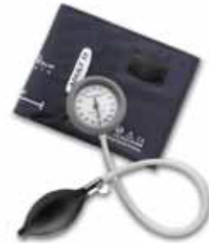
Anéroïde intégré DS44 WEL039

Pour plus d'informations sur les avantages des produits pour tension artérielle intégrant la technologie DuraShock, contactez votre représentant ou rendez-vous sur le site www.welchallyn.com/durashock