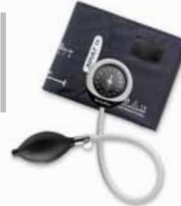
Anéroïde intégré DS45 WEL040

GARANTIE DE 5 ANS SUR L'ÉTALONNAGE • RÉSISTANCE AUX CHOCS DE 76 CM • GARANTIE DE 5 ANS SUR L'ÉTALONNAGE • RÉSISTANCE AUX CHOCS DE 76 CM