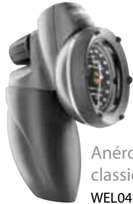
Anéroïde manuel classique DS48A Tycos® WEL045